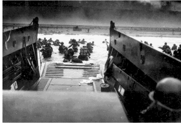
Photo: Les troupes Alliées descendant en Normandie.

Aujourd'hui il y a beaucoup de musées concernant la Seconde Guerre Mondiale. Pendant mes vacances, nous avons visité quelques musées. Il y avait beaucoup d'équipement original, comme des vêtements, des lettres, des plans, des armes etc. et on a collectionné des photos et vidéos de journaux.