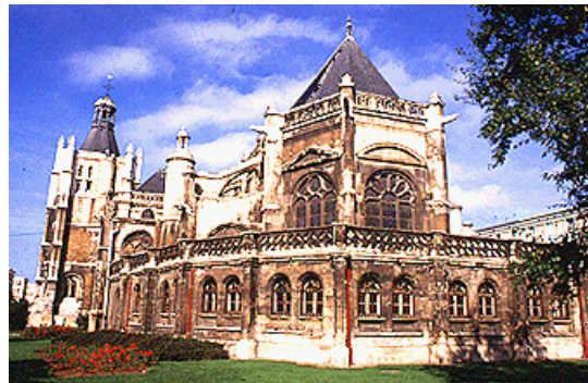
Photo: La Cathédrale Notre-Dame au Havre.

La nef est écrasée sous les bombes de 5 septembre 1944.