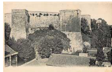
La tour de la Reine Mathilde, vue sur une carte postale vers 1900.