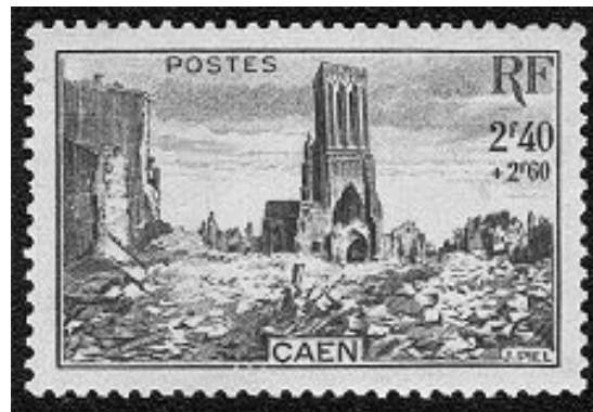
Illustration: Un timbre qui mont la destruction environ l'église.

Pendant le seconde guerre mondiale, tous les bâtiments environ l'église ont été détruit, et comme par miracle seulement l'église restait.