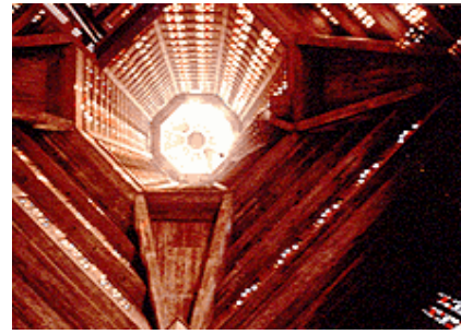
Photos: L'église Saint-Joseph, extérieur et intérieur.